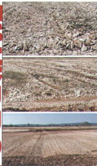
◀ 蜡菊，薰衣草和迷迭香都是在 pH 值 7.7-8 石灰岩上種植，可以幫助根部通風。上圖是磨過一次的石頭，體積太大需要再被磨碎；中間的圖是磨過兩次；下圖是用全歐洲最大的儀器磨過之後的石頭，可以種植了！(Photo Courtesy: Joanne Kan)