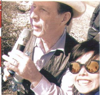
◀ 自費六位數字飛去克羅地亞上課，自己開車去農場，蜡菊還未有收成，但卻野生捕獲 DRC!