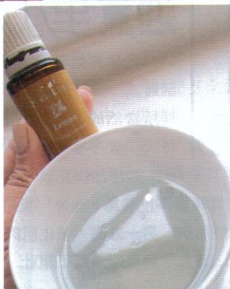
好辛苦先找到支dōTERRA做測試。這就是當日我開始愈用愈覺得奇怪和起疑的檸檬精油。兩滴,幾攤油分散水面,那個黃色的油圈已經黏住杯子邊。